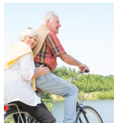
Herrliche Ausblicke aufs Wasser machen den Charme dieser Route aus.